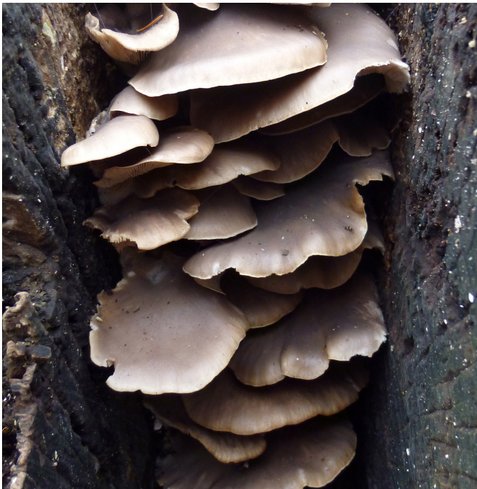
Mushrooms paddenstoelen de Warande Tilburg

To give some volume to a mattress-cover, in the past multiple layers of fabric were sewn together by hand (pitted), or machine. You can achieve the same effect with this 3D knitting, with a filling thread between top and bottom knit.