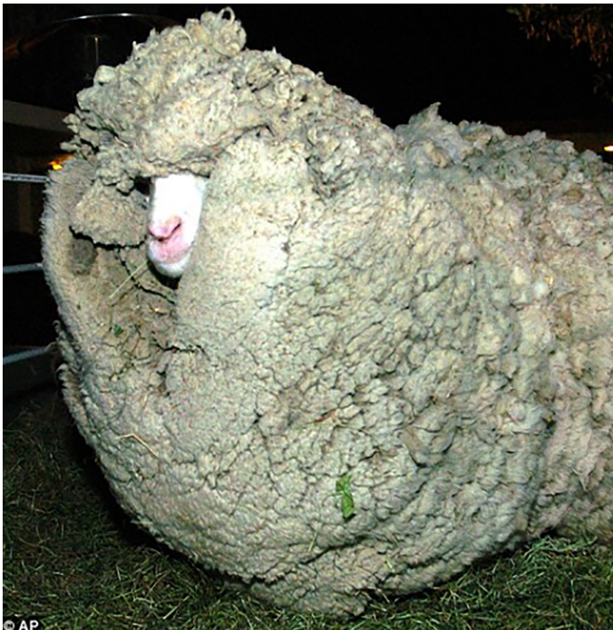
New Zealand lost sheep verloren schaap in Nieuw-Zeeland

Shrek was the most famous New Zealand sheep that got lost. The animal escaped and lived in the wild for 6 years before he was found. After shearing the wool weighed 60 kilos. Shrek lived to be 16.