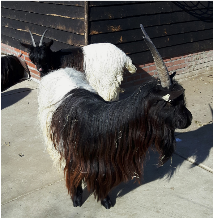
Valais Black neck goat (English Bagot), petting zoo Bijlmer meadow Wallische geit, kinderboerderij Bijlmerweide

For the woven carpet (Pello Weave by Casalis) a sample was made to see which weave and pattern would be possible on the loom.