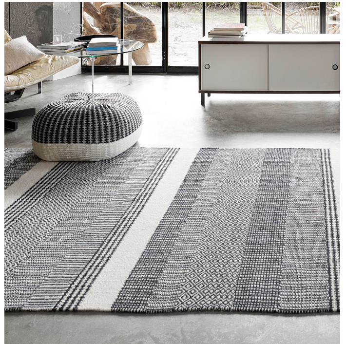
Pello Weave Casalis