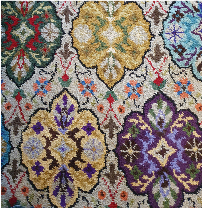
Vintage rug from a thrift shop vintage kleed kringloop winkel

In the sixties and seventies of the last century, hand knotting your own rugs with 7 cm woollen Smyrna yarns was a popular hobby. You needed a pattern, a kind of crochet needle and yarn. The carpet above is hand knotted in that way.