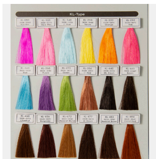
colorcard doll hair kleurkaart poppenhaar

Natural raffia is a product of the Raphia palm from Africa. The palm leaves are stripped, dried and dyed if necessary.