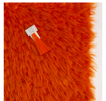
carpet sample made with doll's hair yarn

Proefmonster van tapijt met een garen gemaakt met poppenhaar filament.