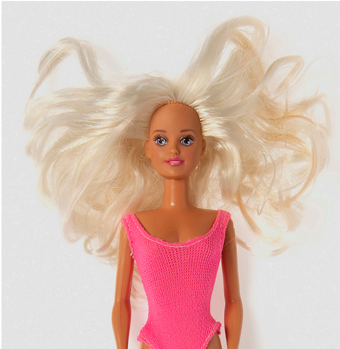
Barbie doll, dolls hair Barbie pop, poppenhaar

What I show here is a filament yarn originally created for dolls hair. I was looking for a high-gloss yarn for a carpet and finally found this. A filament yarn which is made by pressing a liquid substance through the spinnerets. You then get an endless yarn.